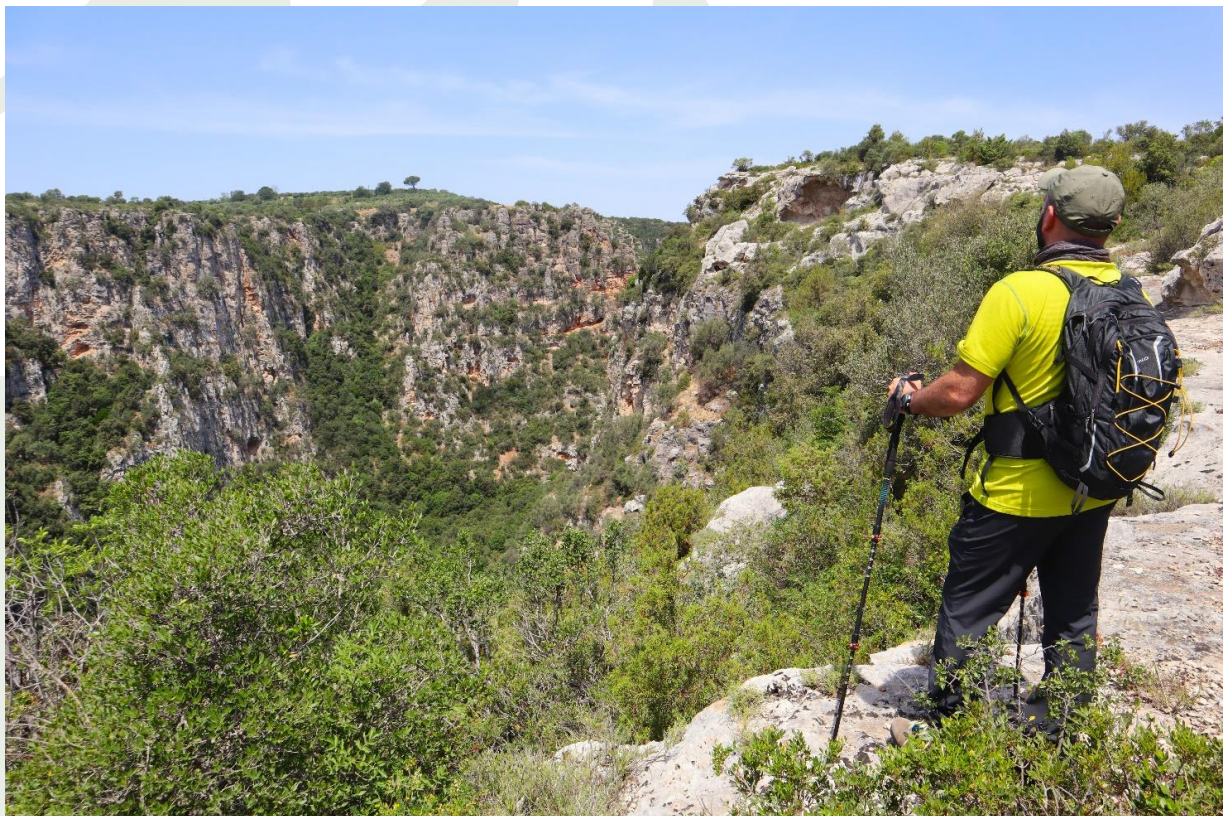
La stupenda visuale della Gravina di Laterza, il canyon più grande d'Europa

Ristorante Vecchio Frantoio , Via Concerie 108, menù del pellegrino 20€, chiuso il lunedì.