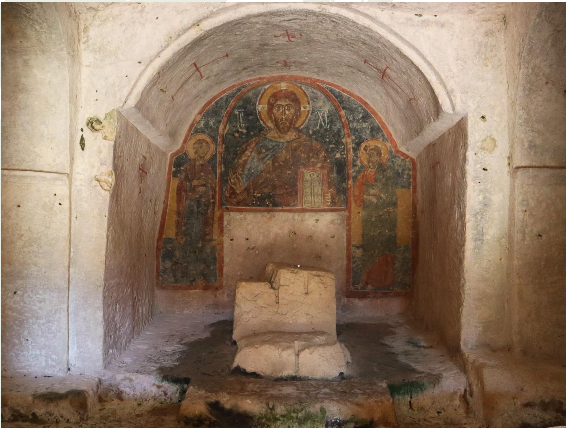
Gli splendidi affreschi medievali della chiesa rupestre di San Nicola (Mottola)

Trattoria Urbana Casa 28 , Via San Francesco 89, tel. +393286812984, menù del pellegrino €18, chiuso il lunedì.