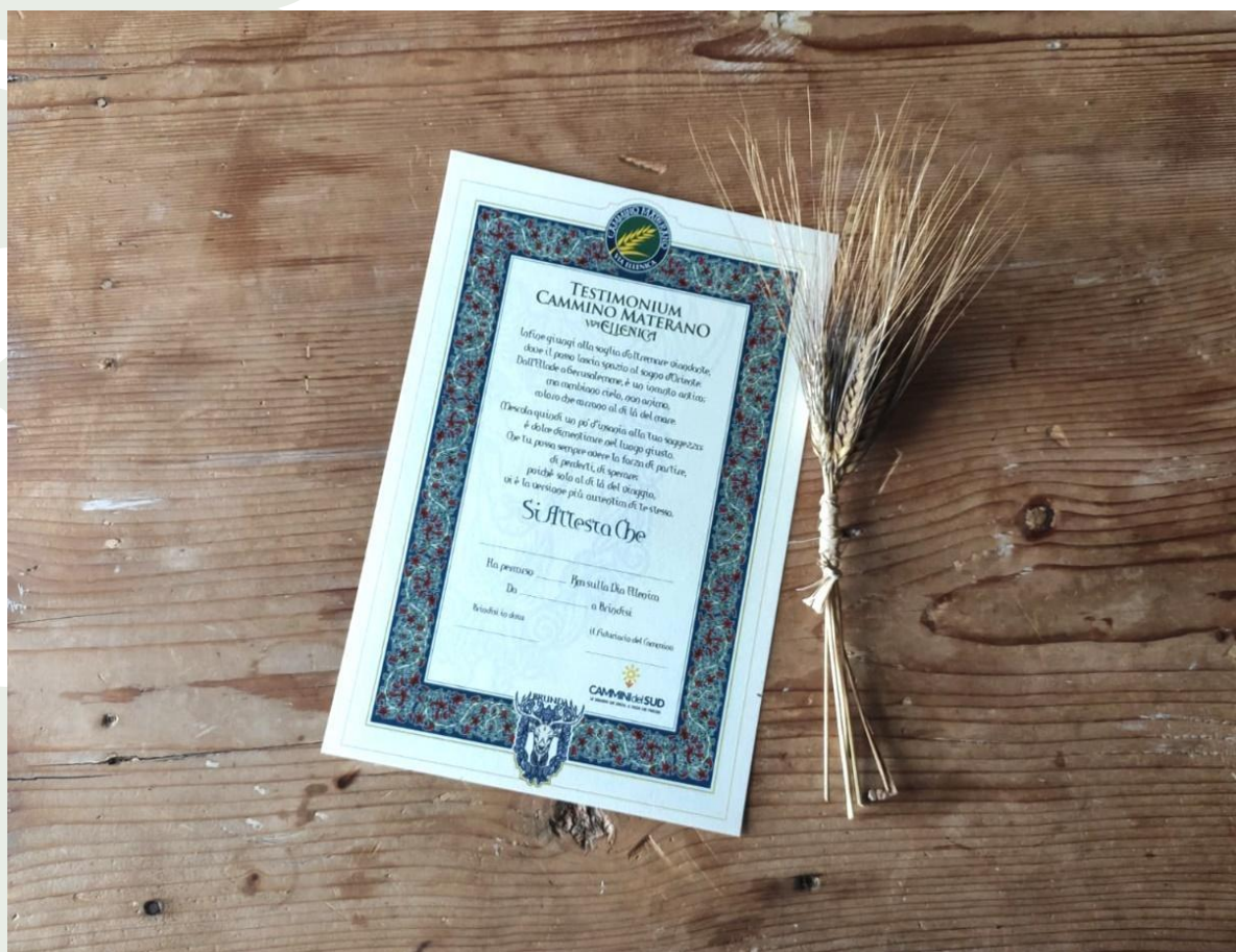
Lo Xenium, la pergamena del viandante