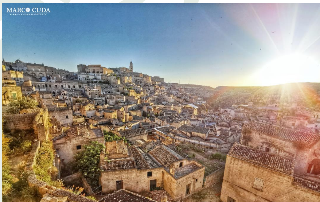
Il centro storico di Matera

Osteria Malatesta , via San Biagio 45, tel. 331-28.87.242, 10% sconto sul menù alla carta, chiuso il mercoledì e domenica sera.