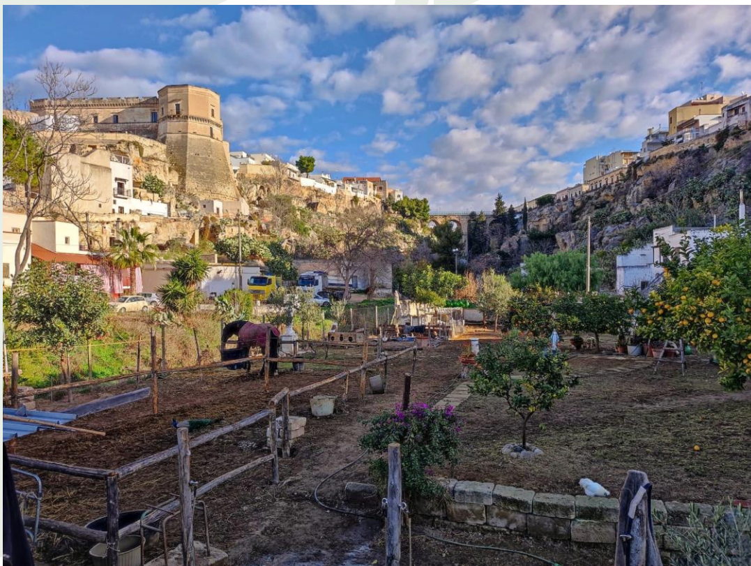
Veduta del fondo della gravina di San Marco a Massafra, con Castello.

La Locanda di Zia Riri , Piazza Pio XI n.9, tel. 3496481621, 3427468666, menù del pellegrino a 18€, chiuso il lunedì.