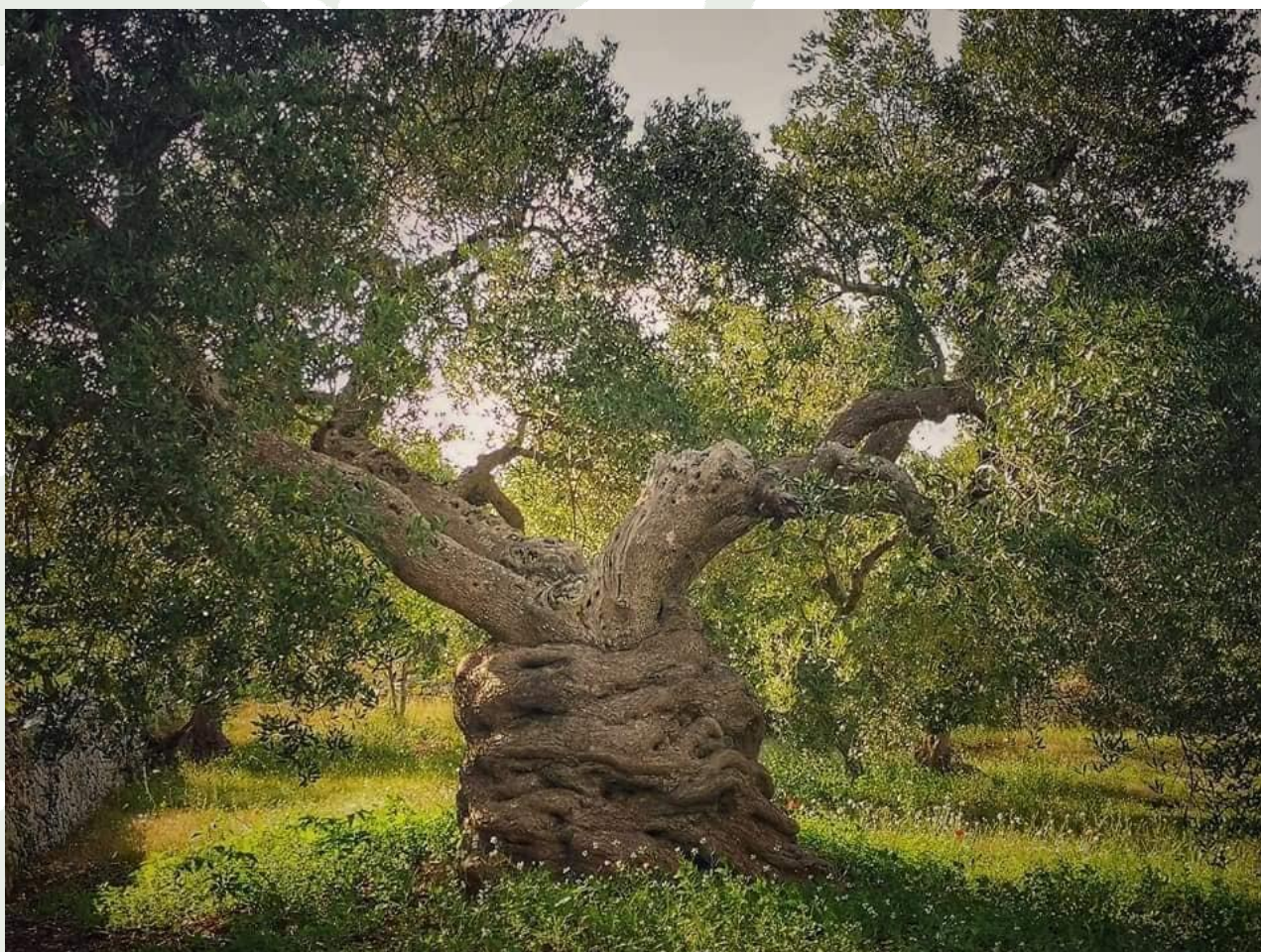
Ulivo Secolare

B&B Coppularossa , CIS BR07400261000015846/BR07400261000015638/BR07400261000015845, Via Palazzeschi 1, 9 posti, tel.320 9074676, SGL €35, DBL €50, TPL €75, QDB €95, con colazione e wi- fi. Ammessi animali piccola taglia.