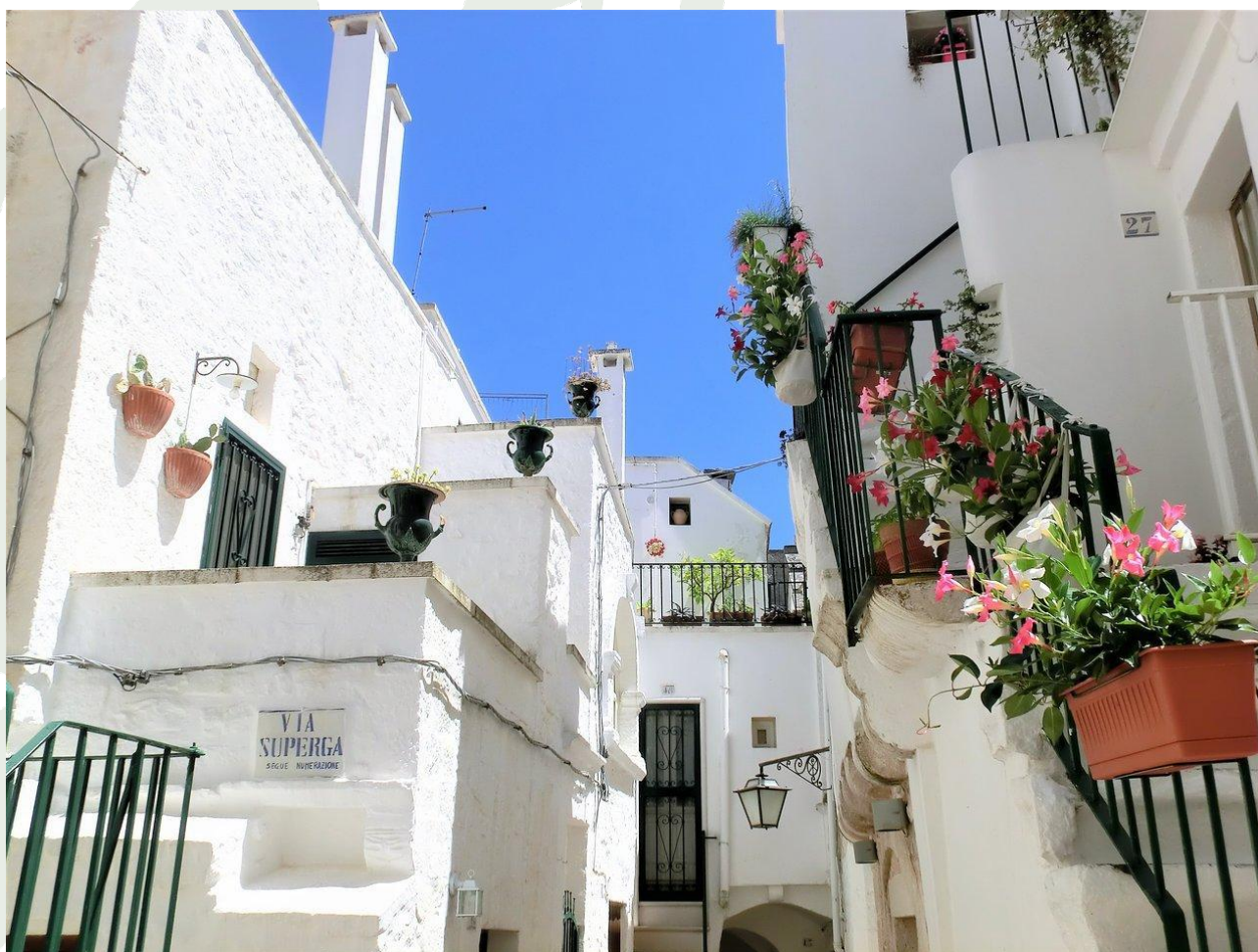
Centro storico di Cisternino

Trattoria Le Chicche di Zia Rosa , Via Tarantini 6, tel. 080 4447030, menu del pellegrino a €15 (menu alla carta i festivi).