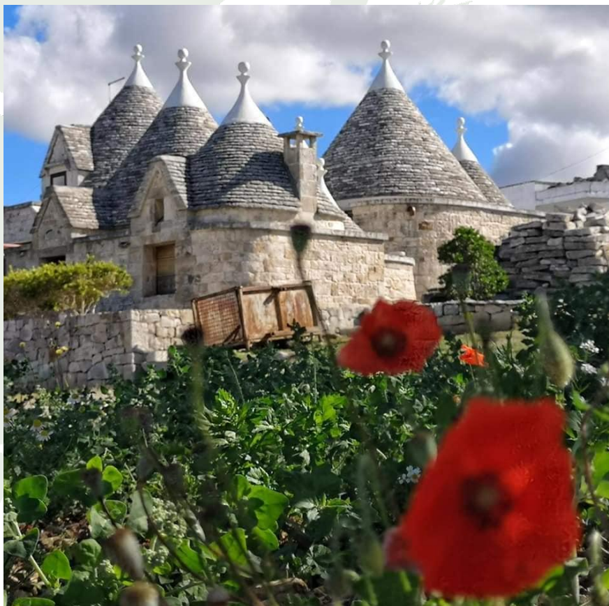
Trulli della Valle d'Itria

Trattoria La Pignatta , Via Vittorio Veneto 110, tel. 080 4316391/333 4709206, menu del pellegrino a €15.