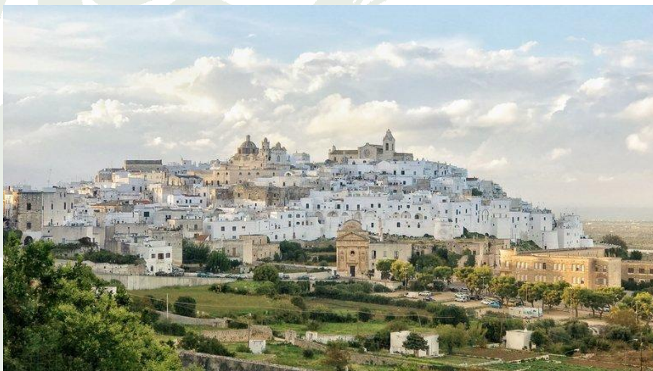
Veduta di Ostuni

Monastero delle Benedettine di San Pietro , accoglienza religiosa, contrada Santa Maria d'Agnano, a 2.7 km da Ostuni lungo la traccia Ostuni-Cisternino, tel. 0831 602094/342 6268707, 15 posti, €20 a persona, stanze con bagno in camera con lenzuola e asciugamani, con colazione e wi-fi, uso cucina, no animali. Possibilità di piazzare la tenda, a donativo. Possibilità di cenare (comunicare alla prenotazione) a €12.